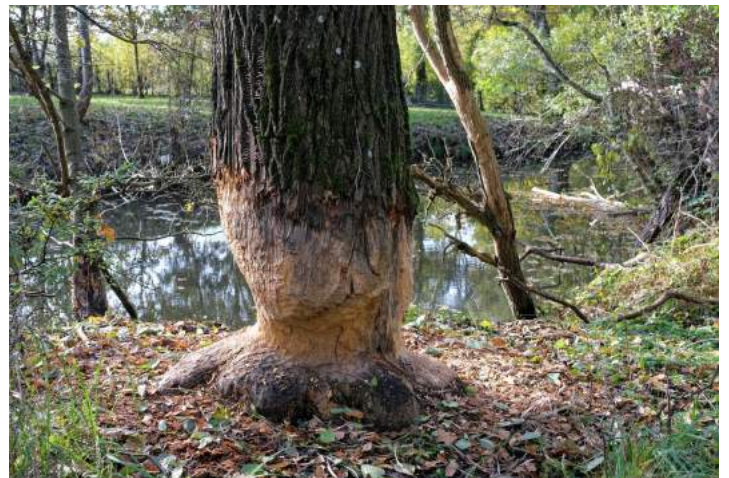
La biodiversité dans les Prairies de Pont-aux-Moines : impressionnant travail des castors.

En partenariat avec la commune de Chécy, Orléans-Métropole, le Syndicat des rivières et l'Agence de l'Eau, nous avons poursuivi nos démarches pour préparer l'aménagement du terrain dit « Les prairies de Pont-aux-Moines » , les anciennes terres du moulin dans le cadre de la protection de la biodiversité . Dans le même esprit, un inventaire communal de la biodiversité sur notre commune va être réalisé avec la Métropole, celui-ci devrait nous permettre de valoriser la richesse de la commune liée à la grande variété de ses milieux et de ses paysages.