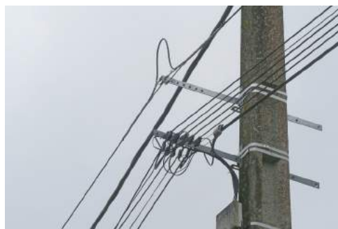
En bas fils de cuivre, en haut fibre en attente du boîtier.

Par ailleurs, dans les quartiers équipés, il peut arriver que telle ou telle adresse ne soit pas raccordable. Dans ce cas, vous pouvez le signaler à la mairie qui transmettra directement à SFR l'adresse non desservie afin qu'il y ait une intervention le plus rapidement possible (cela peut néanmoins prendre plusieurs mois, l'engagement de SFR étant de tout boucler avant la fin 2020 ; il est cependant important de repérer les foyers « oubliés. »)