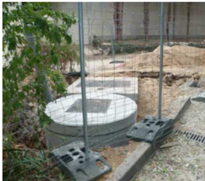
Création d'un poste de refoulement en béton