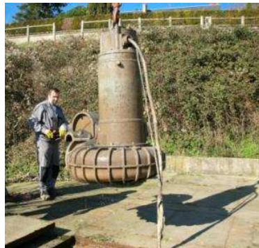
Changement d'une pompe de relevage