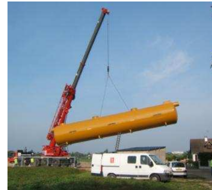
Pose d'un séparateur à hydrocarbure