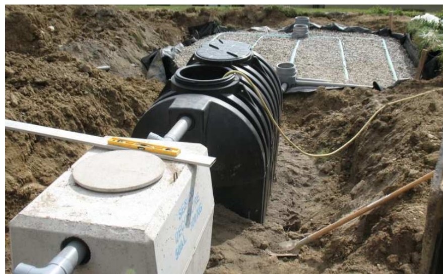
Contrôle de travaux à Boigny-sur-Bionne